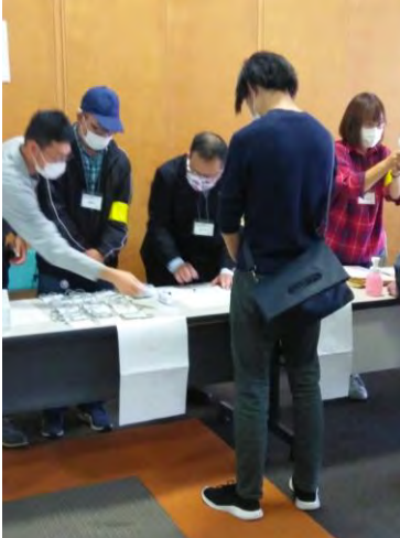
受付で奮闘する大阪いちょうの会・ 和歌山あざみの会・ 尼崎あすひらく会の仲間たち