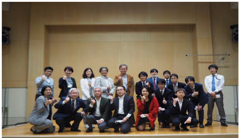
集会後の実行委員会スタッフのみなさん ご苦労さまでした。