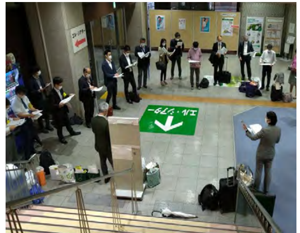
8時すぎからのスタッフミーティング